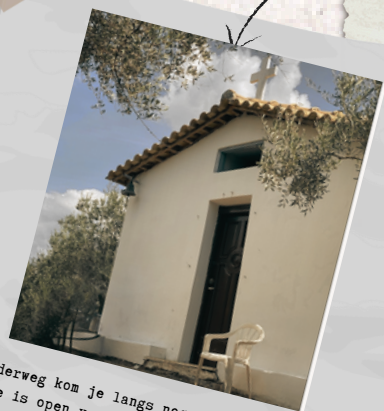
Onderweg kom je langs nog een kappeletje. Deze is open voor bezichtiging en een fijn plekje om even uit te rusten en op adem te komen.

BIJ MAESTRO'S BAKERY KUN JE GENIETEN VAN HEERLIJKE GEBAKJES, BROODJES EN VERSE JUS DIE JE MEE KUNT NEMEN NAAR DE TOP VAN DE BERG. ZO CREEËR JE ZELF ONVERGETELIJKE MOMENTEN!